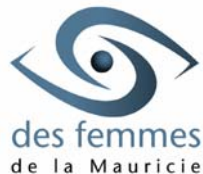
Table de concertation du mouvement

1337, boul. du Carmel Trois-Rivières, Québec G8Z 3R7 Téléphone : (819) 372-932 Fax : (819) 372-0766 Courriel : tcmfm@globetrotter.net